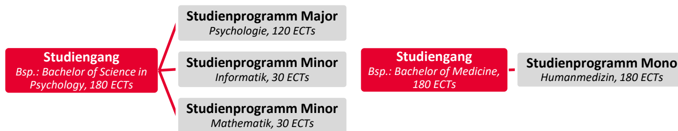
Abbildung 1: Der Studiengang entspricht dem Studienziel eines Studierenden.

In den meisten Statistiken der Universität Bern werden die Studienprogramme auf einer höheren Strukturebene zusammengefasst dargestellt, der Studienprogrammgruppe . Die Studienprogrammgruppe ist eine Gruppierungsebene, welche Studienprogramme mit unterschiedlichen Schwerpunkten oder unterschiedliche Studienplanversionen vereint.