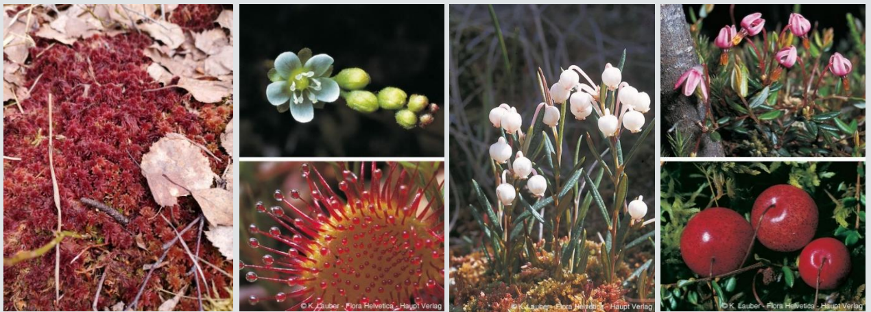
Abbildungen: Hochmoor-Spezialisten: Ein Torfmoos, rundblättriger Sonnentau, Rosmarinheide und Moosbeere (v.l.n.r.).

Hochmoore sind vom Wasser geprägte Lebensräume. Die alles bestimmende Pflanze ist das Torfmoos. Dank Speicherzellen können Torfmoose das 20- bis 30-fache ihres Gewichts an Wasser speichern. Zudem entwickeln Torfmoose starke Kapillarkräfte zwischen den Blättern und Stängeln, so dass der Moor-Wasserspiegel höher ist als der Grundwasserspiegel. In trockeneren Phasen entsteht für die anderen Pflanzen Wassermangel, in regnerischen Phasen müssen sie mit wassergesättigtem Untergrund klarkommen. Zudem sind die obersten Bereiche von intakten Mooren regenwassergeprägt (ombrotroph). Regenwasser ist sauer (pH 6) und nährstoffarm. Torfmoose können Nährstoff-Ionen (z.B. Kalzium oder Kalium) gegen Protonen austauschen. So wird das Wasser im Moor noch saurer (pH 4) und noch nährstoffarmer.