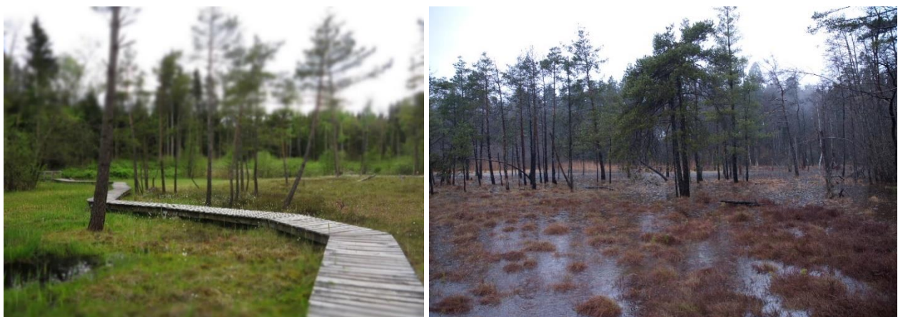
Abbildungen: Besucherlenkung im Lörmoos; überflutetes Lörmoos 2006

Biodiversität: In der Schweiz bedecken Moore nur noch 0.5% Prozent der Landesfläche. Ungleich wichtiger sind diese Reliktflächen für die Biodiversität, ein Viertel der gefährdeten Pflanzenarten befindet sich in Mooren. Mit Annahme der Rothenthurm-Initiative im Jahr 1987 wurden die noch verbleibenden Moorflächen unter Schutz gestellt, um die moorspezifische Biodiversität zu erhalten. Bereits geschädigte Moorflächen sollen soweit möglich aufgewertet und wiederhergestellt werden.