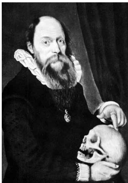
Wilhelm Fabry (1560–1634) wirkte im 17. Jh. in Bern als Stadtarzt und Chirurg.

Der Schlüssel hierfür sei Fabrys Verständnis der Anatomie als Grundlage der Chirurgie