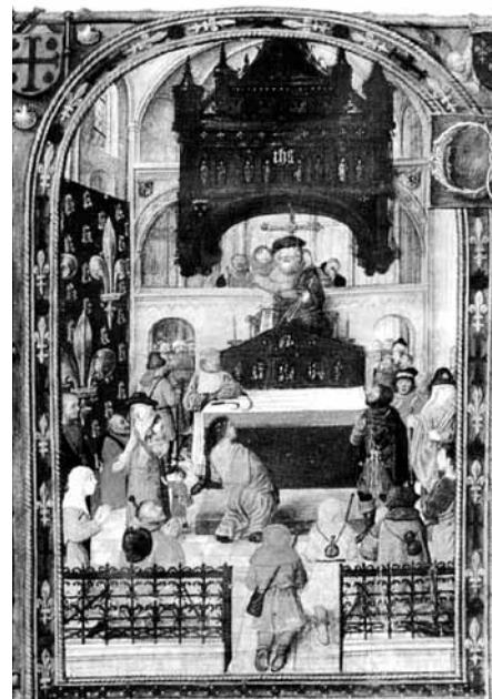
Pilger verehren den heiligen Jakob in der Kathedrale von Santiago de Compostela.

Ihren Höhepunkt erreichten die transnationalen Pilgerfahrten nach Santiago