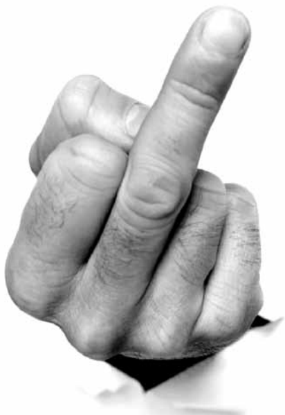
Gesten können eine beleidigende Äusserung verstärken.

Eine beleidigende Äusserung allein macht noch keine Beleidigung aus: Die jeweilige Situation und die Reaktionen des Angegriffenen bestimmen, ob die Beteiligten eine Beleidigung als solche wahrnehmen.