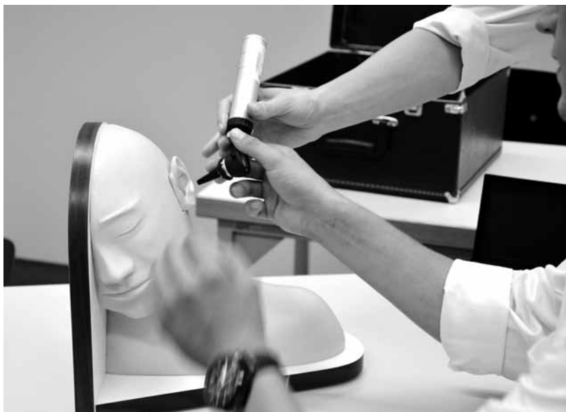
Medizinstudierende üben die Untersuchung des äusseren Gehörgangs am Modell.