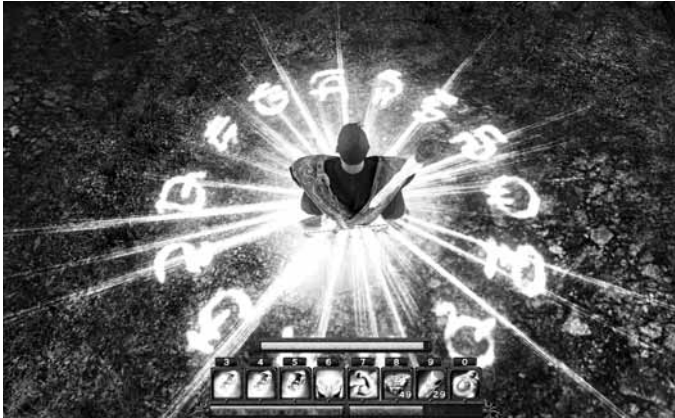
Religiöse Symbolik vermittelt in Computerspielen Authentizität.

Computerspiele sind beliebt – und ihre Inhalte entstammen häufig den Vorstellungswelten historischer Religionen, die Handlungen sind gespickt mit spiritueller Symbolik. Werden dadurch die Gamer religiöser? Der Berner Religionswissenschaftler Oliver Steffen verneint.