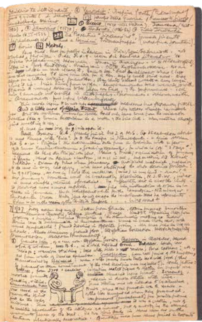
Eine Doppelseite des dritten der sechs German Diaries von Samuel Beckett mit Einträgen aus Berlin vom 6. und 7. Januar 1937.