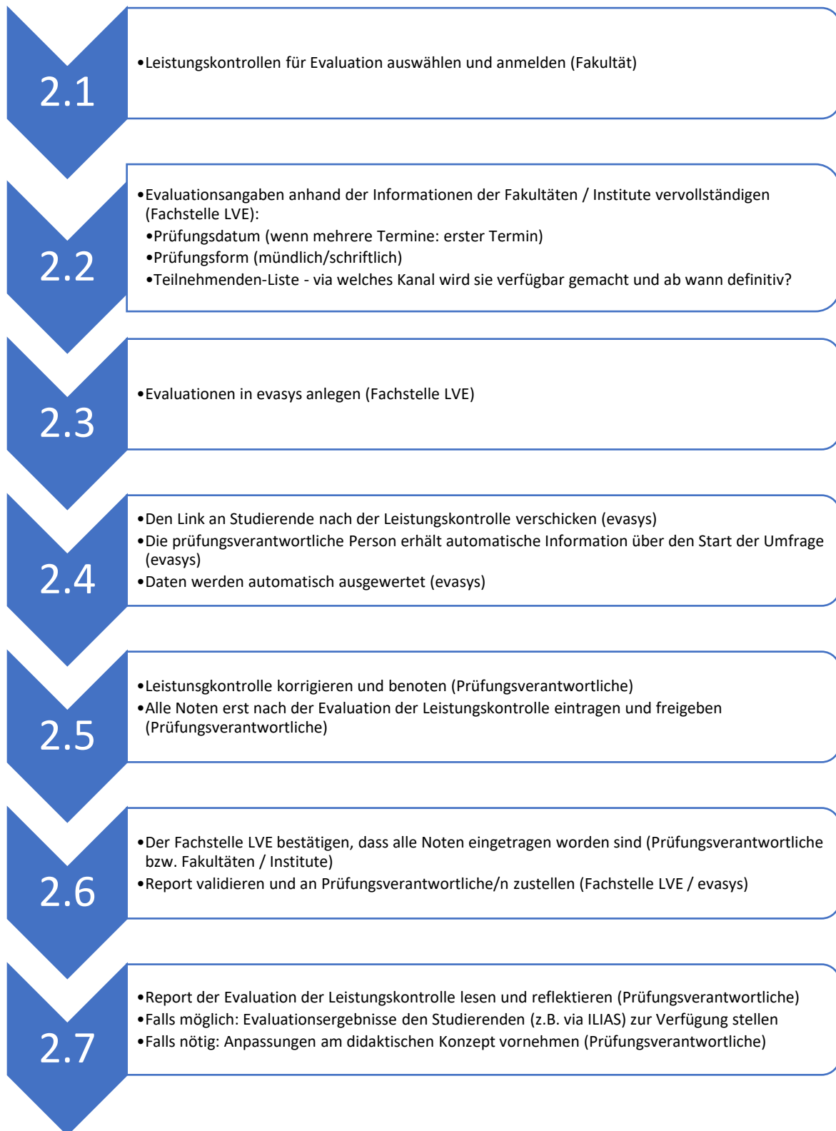
Abbildung 2: Ablauf Evaluation der Leistungskontrollen