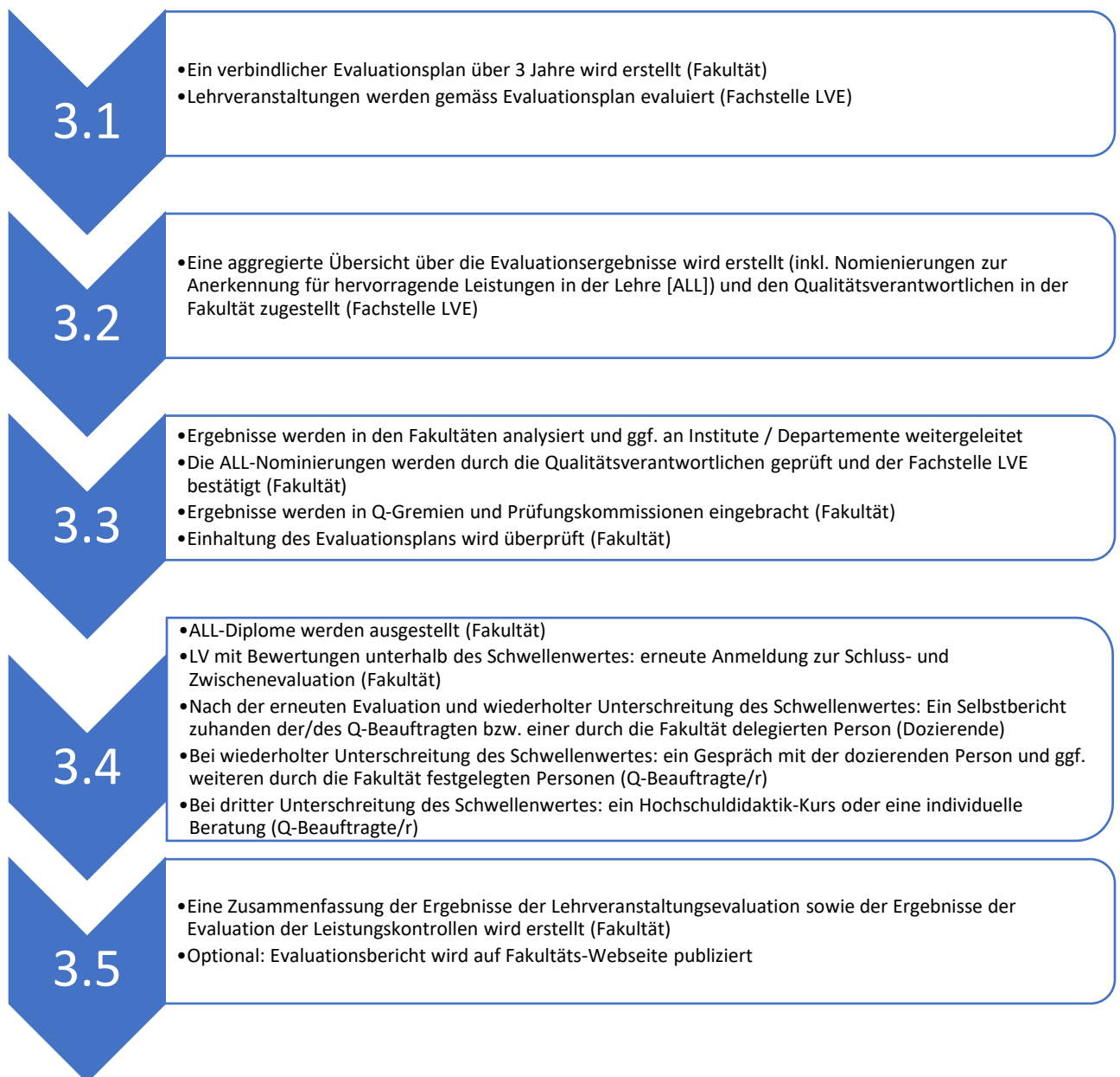
Abbildung 3: Ablauf Lehrveranstaltungsevaluationen auf Fakultätsebene