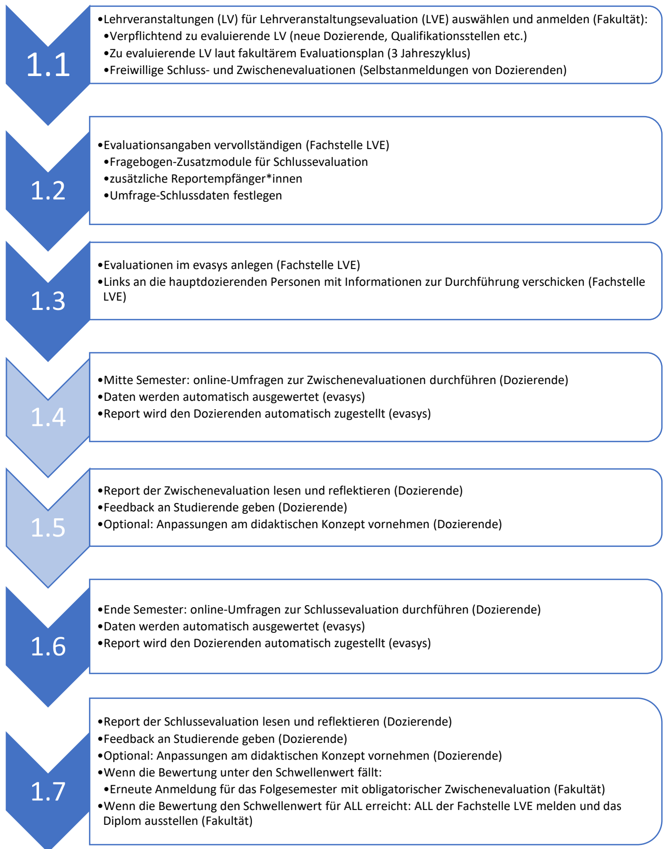
Abbildung 1: Ablauf Lehrveranstaltungsevaluationen (Zwischenevaluation und Schlussevaluation)